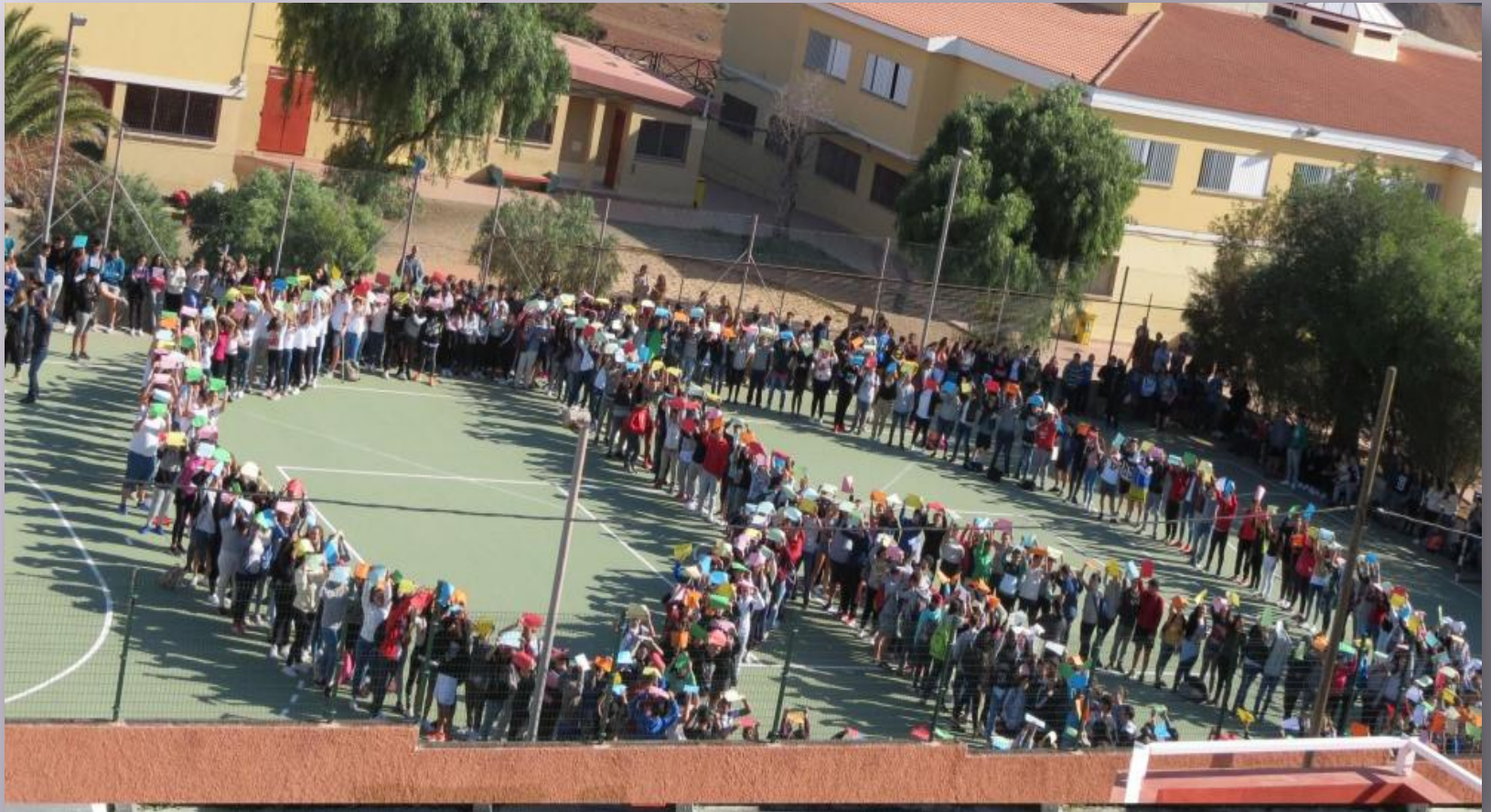
IES Cruce de Arinaga en Arinaga