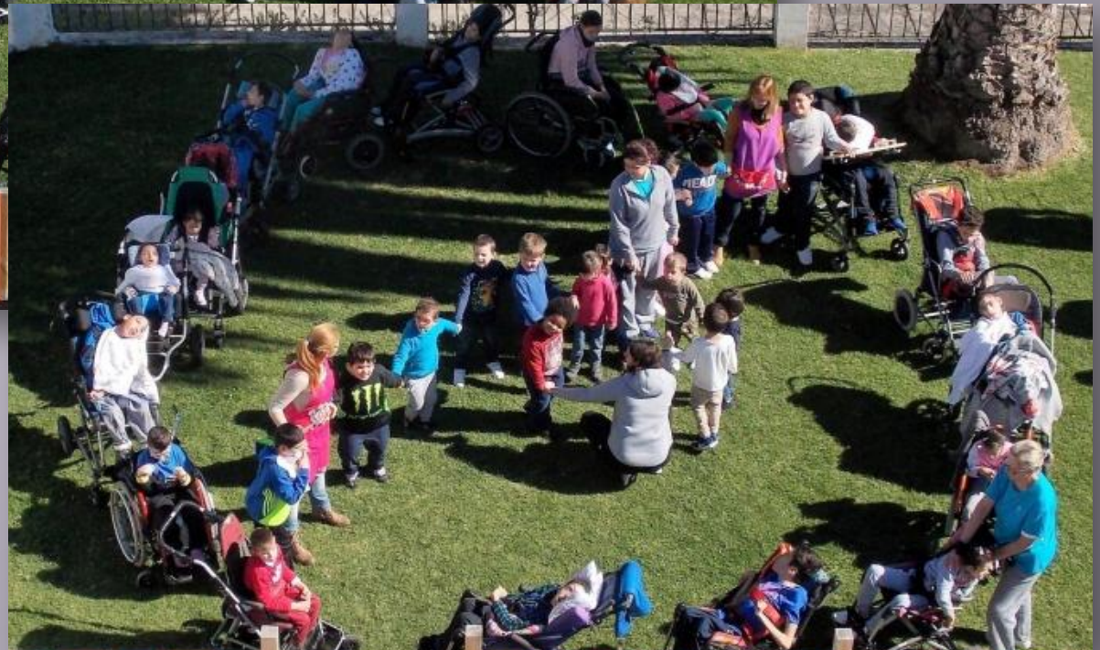
CPEE La Casita en Las Palmas