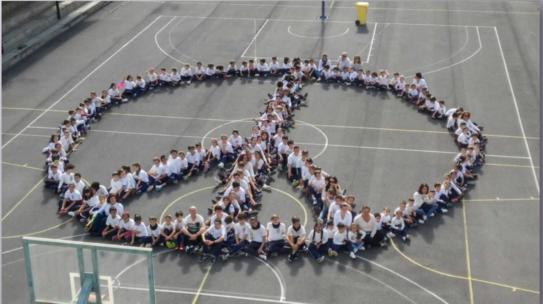
CEIP Alfonso Spinola en Santa Cruz de Tenerife