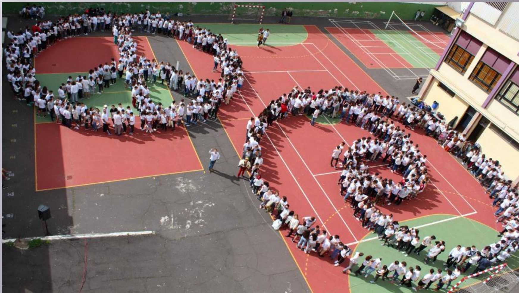
IES Teobaldo Power en Santa Cruz de Tenerife