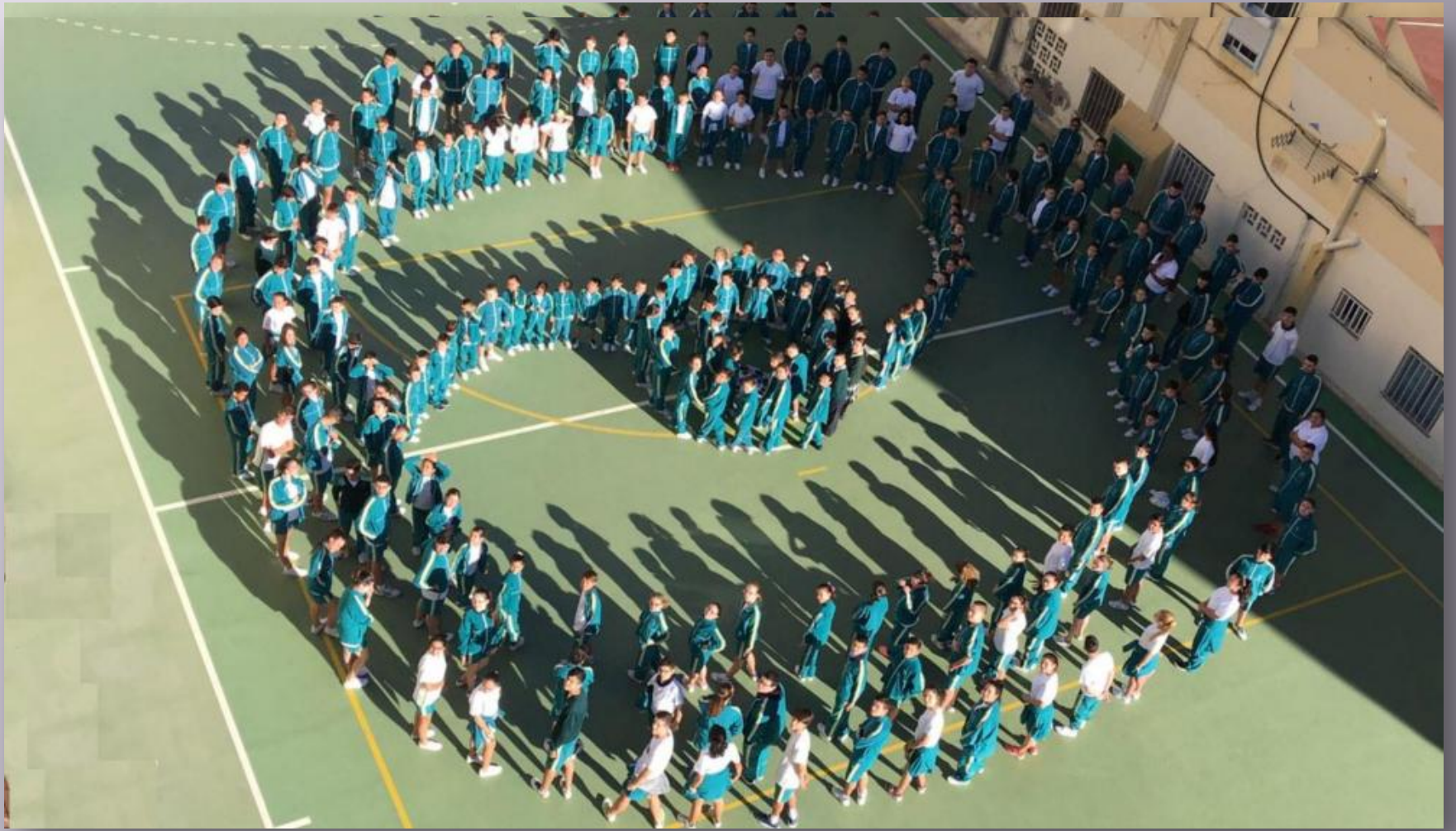
Colegio San Rafael en Las Palmas