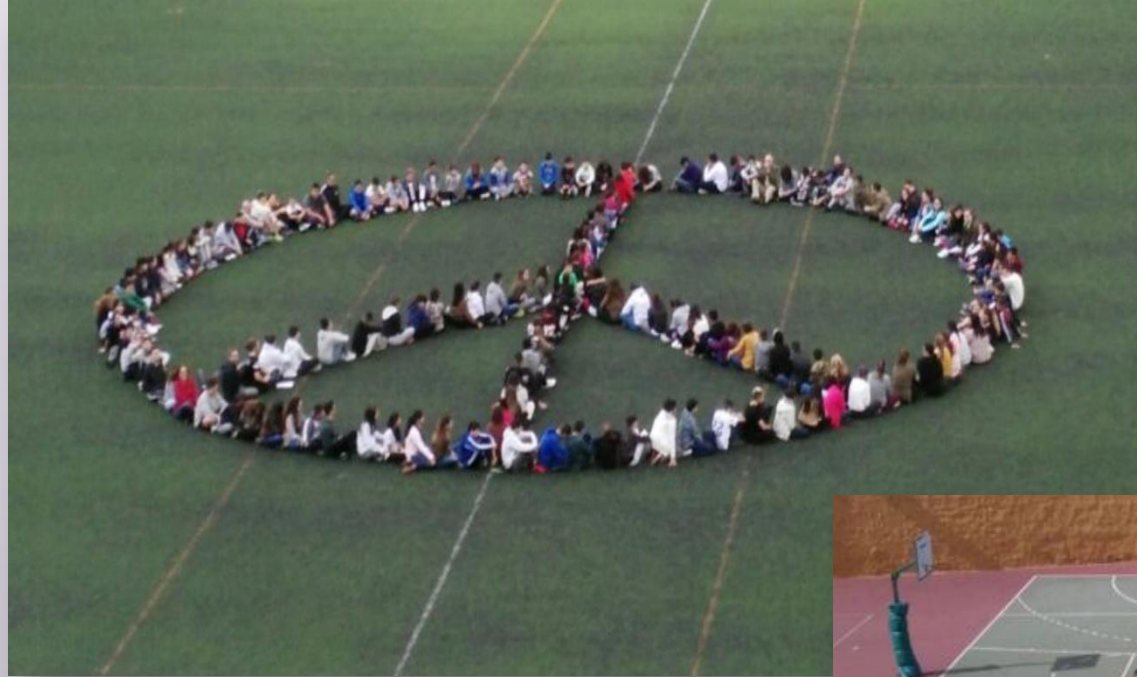
IES El Batán en Las Palmas