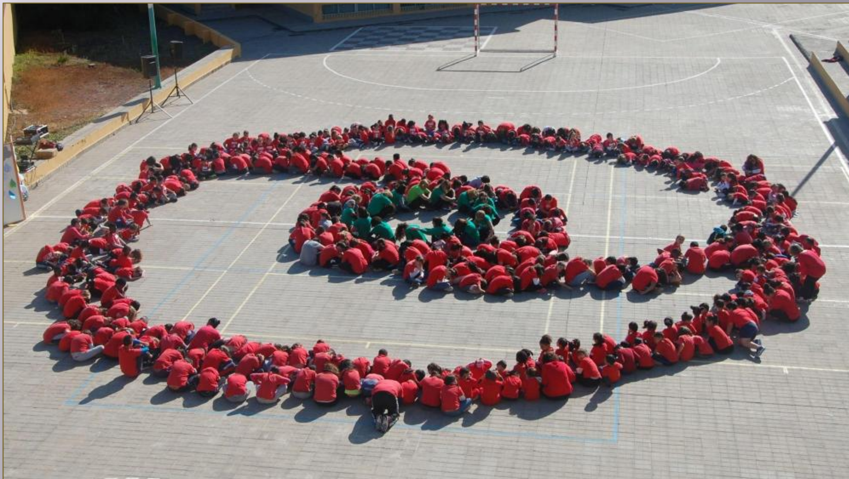
CEIP El Canario en Vecindario