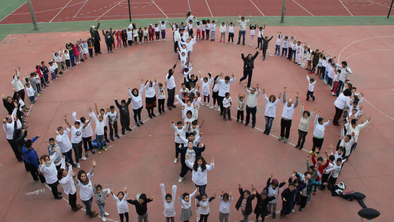
Colegio Nuñez de Arenas - Vallecas