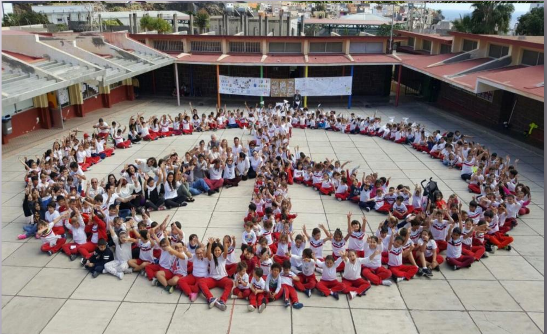
CEIP Gesta 25 de julio en Santa Cruz