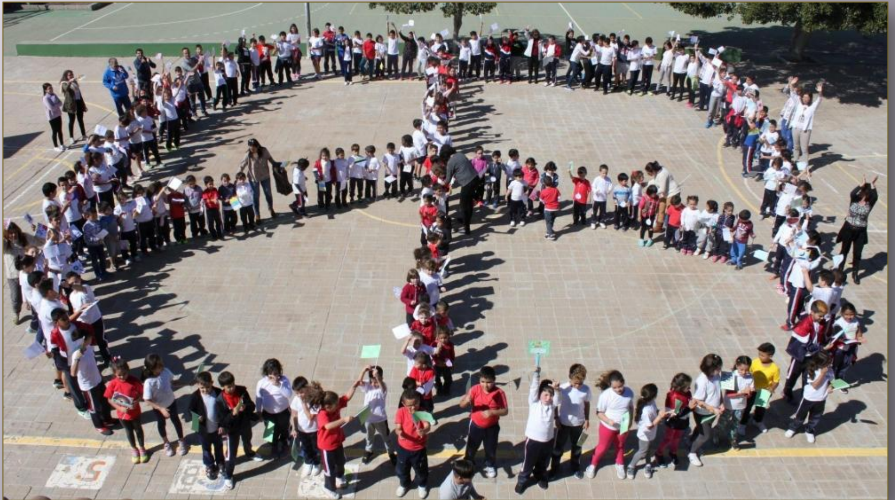
CEIP La Paredilla en Vecindario