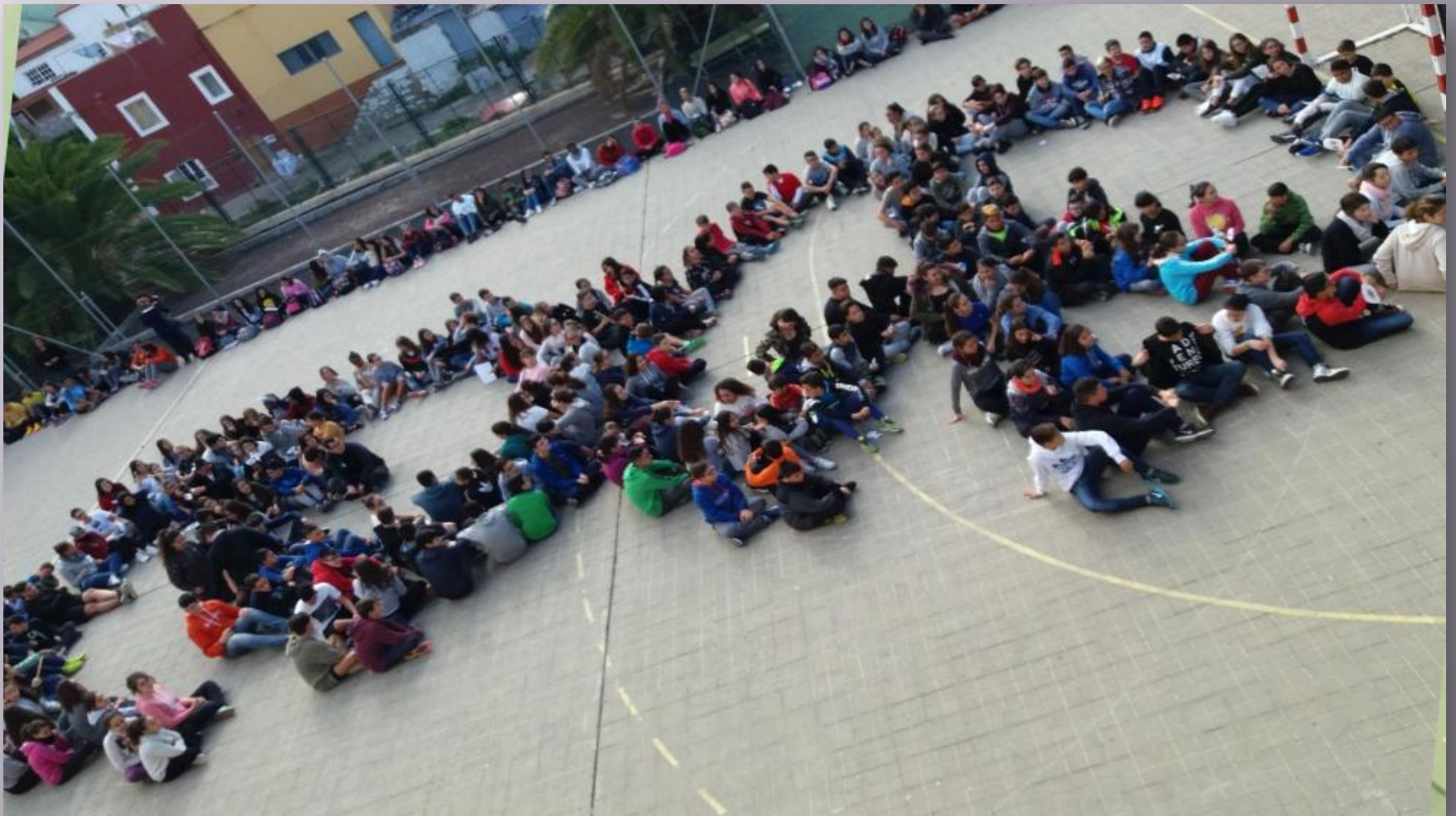
IES José Frugoni en Telde