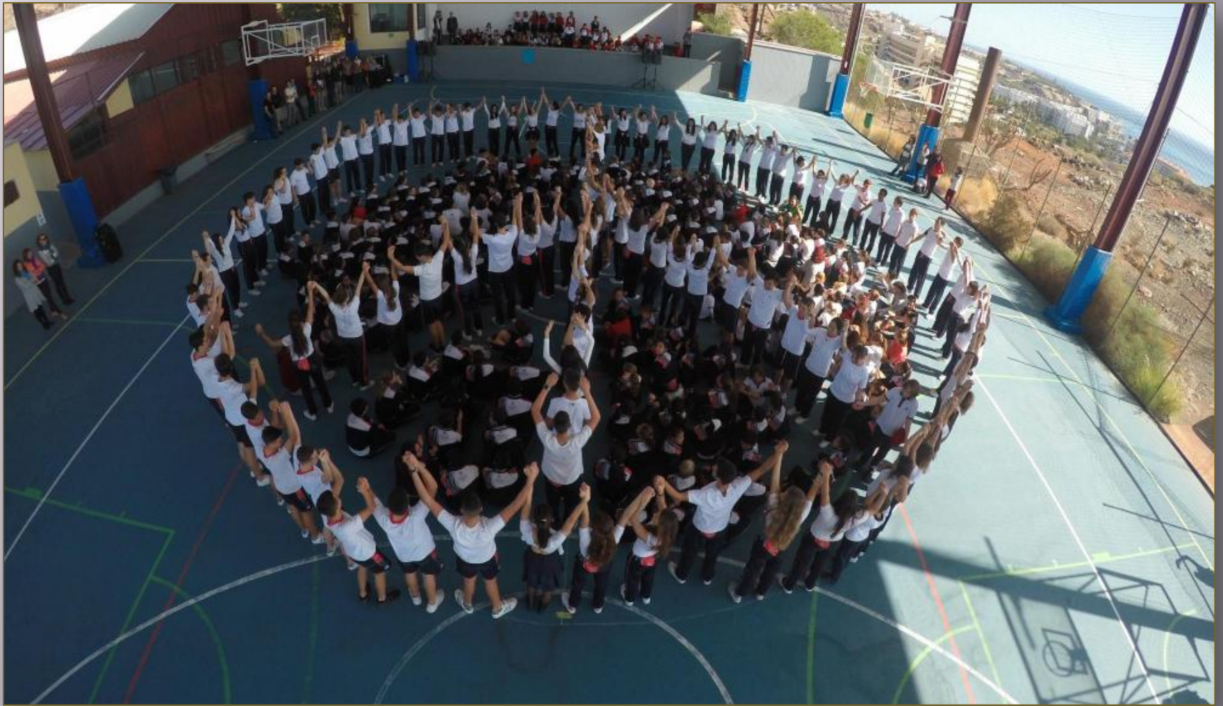
Colegio Arenas Sur en Maspalomas