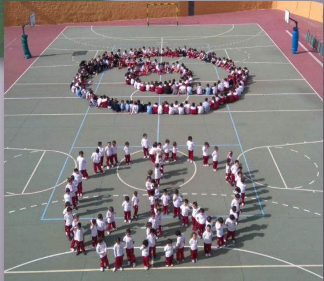
CEIP Fernando Guanarteme en Galdar